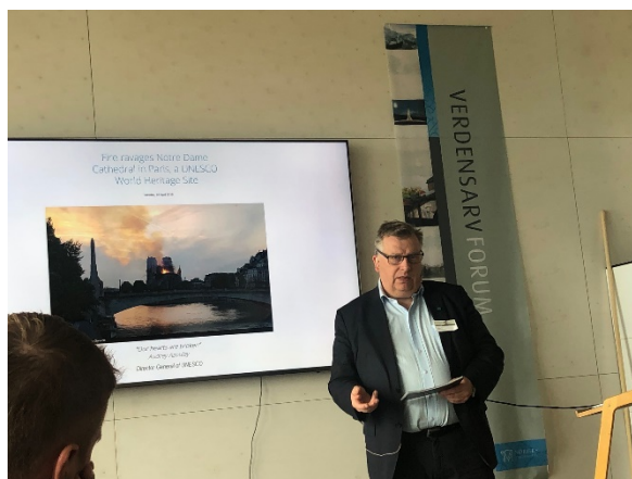
Figur 1. Statssekretær Ate Hamar var tilstede