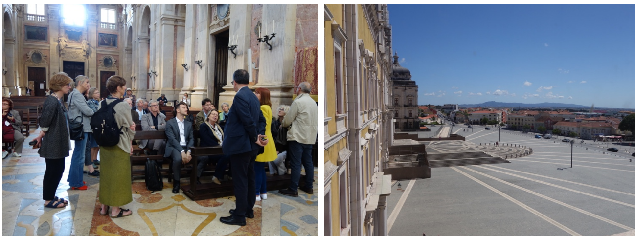
Besøk i Mafra nasjonale klosterpalass.