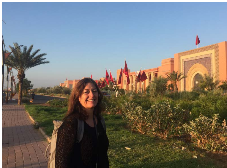
Presidenten på plass ved kultursenteret Habous' Mohammed VI, hvor AC- møtet fant sted.

Klimautfordringen og rettighetsbasert tilnærming til rural kulturarv var den røde tråden gjennom symposiet. Tema som ble belyst var mellom annet immateriell kulturarv og åndelige steder sett i lys av økt turisme. Og hvordan håndtere tradisjonelle byggemetoder og lokale praksiser som ikke er bærekraftige? Andre stikkord for presentasjonene var: Kobling praksis og kultur / natur; Innovasjon; Landsdelspolitikk og styring; Lovgivning og økonomi.