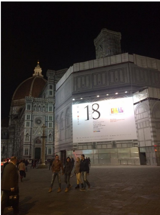
I Firenze satt ICOMOS 18. Generalforsamling sitt preg på bybildet.

Kjære gamle og nye medlemmer i ICOMOS Norge.docx