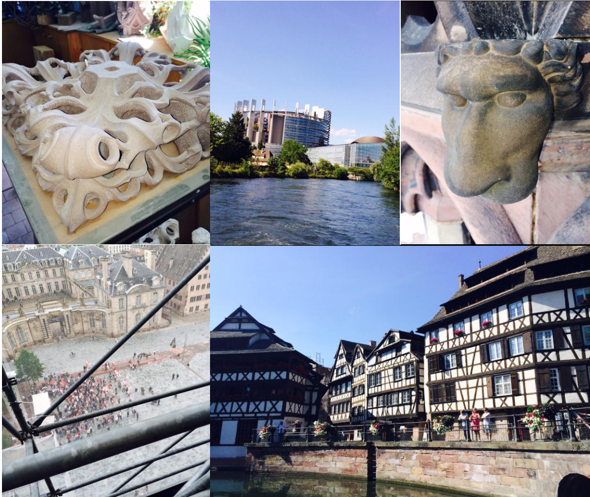
Inntrykk fra Strasbourg.